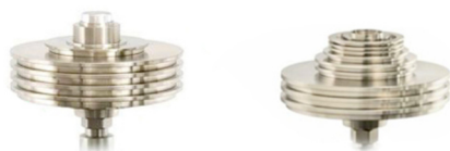
Измерительные поршневые системы МП и МПП с наборами грузов

Измерительные поршневые системы МП и МПП с наборами грузов.